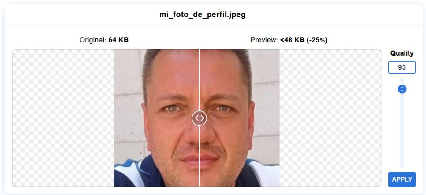
Figura 4.4 Reducción de la calidad de la imagen mediante ImageCompressor.com

La captura de pantalla siguiente muestra cómo aplicando una reducción en la calidad del 100-93=7% en la fotografía de ejemplo conseguimos bajar el peso de la misma a 48KB, por lo que esta foto ya sería válida para subirla a PV.