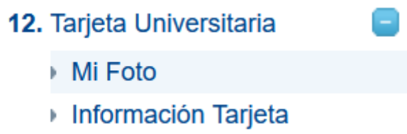
Figura 3.1 – Acceso sección tarjeta universitaria

El alumno debe acceder a la plataforma Politécnica Virtual ( https://www.upm.es/politecnica_virtual/ ) y en la sección Mis Datos -> Tarjeta Universitaria -> Mi Foto añadir una nueva fotografía que cumpla con las especificaciones anteriormente citadas.