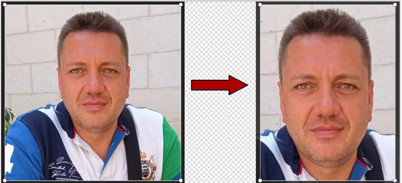
Figura 4.1 Recorte de la imagen y selección del rostro

Si estamos utilizando un equipo con el sistema operativo Windows, podemos utilizar la aplicación "FOTOS" que viene instalada con el sistema.